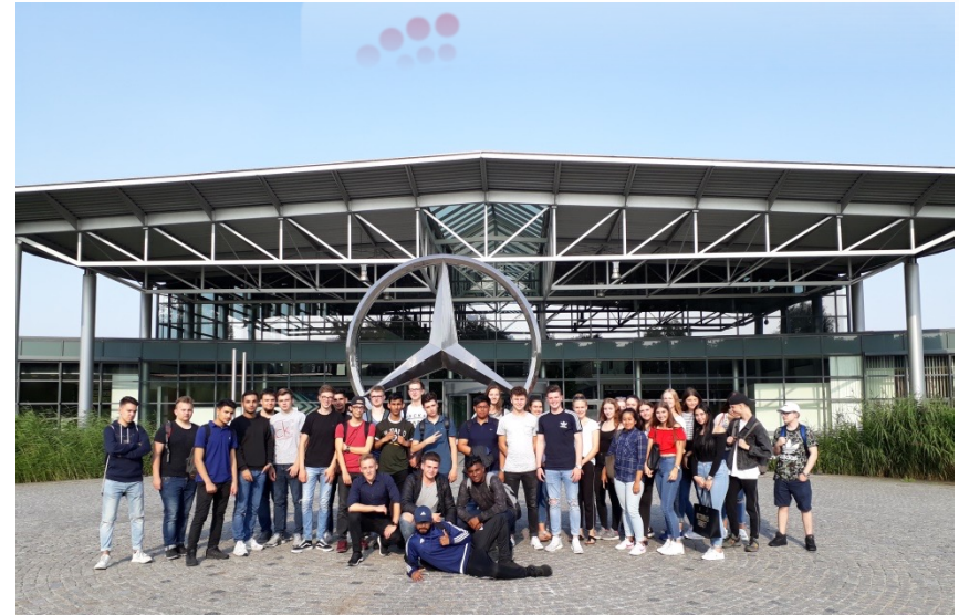
Besuch zweier Q2-Leistungskurse beim Mercedes Werk in Bremen